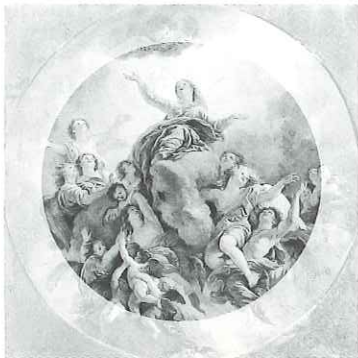
C. de la Fosse, L'Assomption

L'image est structurée sur un schéma triangulaire. Le regard est conduit vers le sommet.