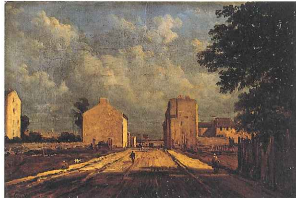
V. de Grailly, Une rue au Grand Montrouge