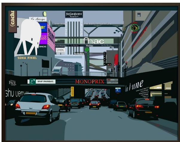
Plan Voisin de Paris - V2 circulaire secteur C25, 2007, Épreuve chromogène laminée diasec sur aluminium, 170 x 229 cm →

Alain Bublex, sur le site de la galerie Vallois, www.galerie-vallois.com