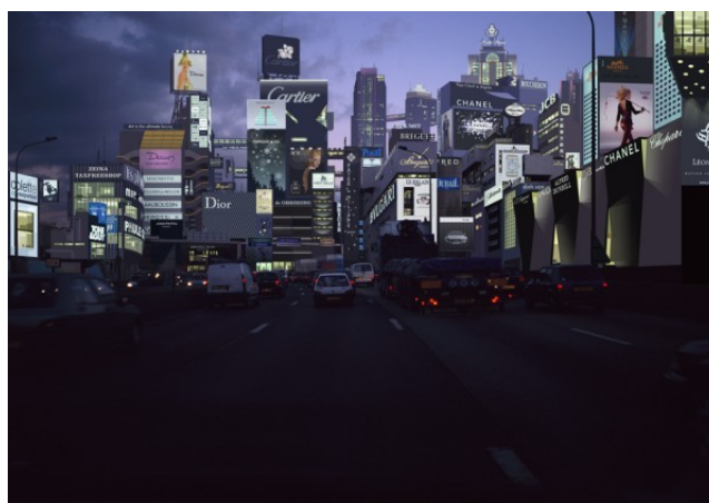
Paysage 81 (Fantôme Plan Voisin de Paris - V2 circulaire secteur C6), 2010, Épreuve chromogène laminée diasec sur aluminium, 141,5 x 180 cm