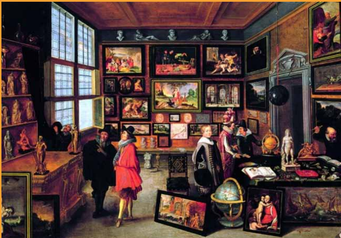
Cabinet d'amateur de Cornelis de Baellieur (1637)